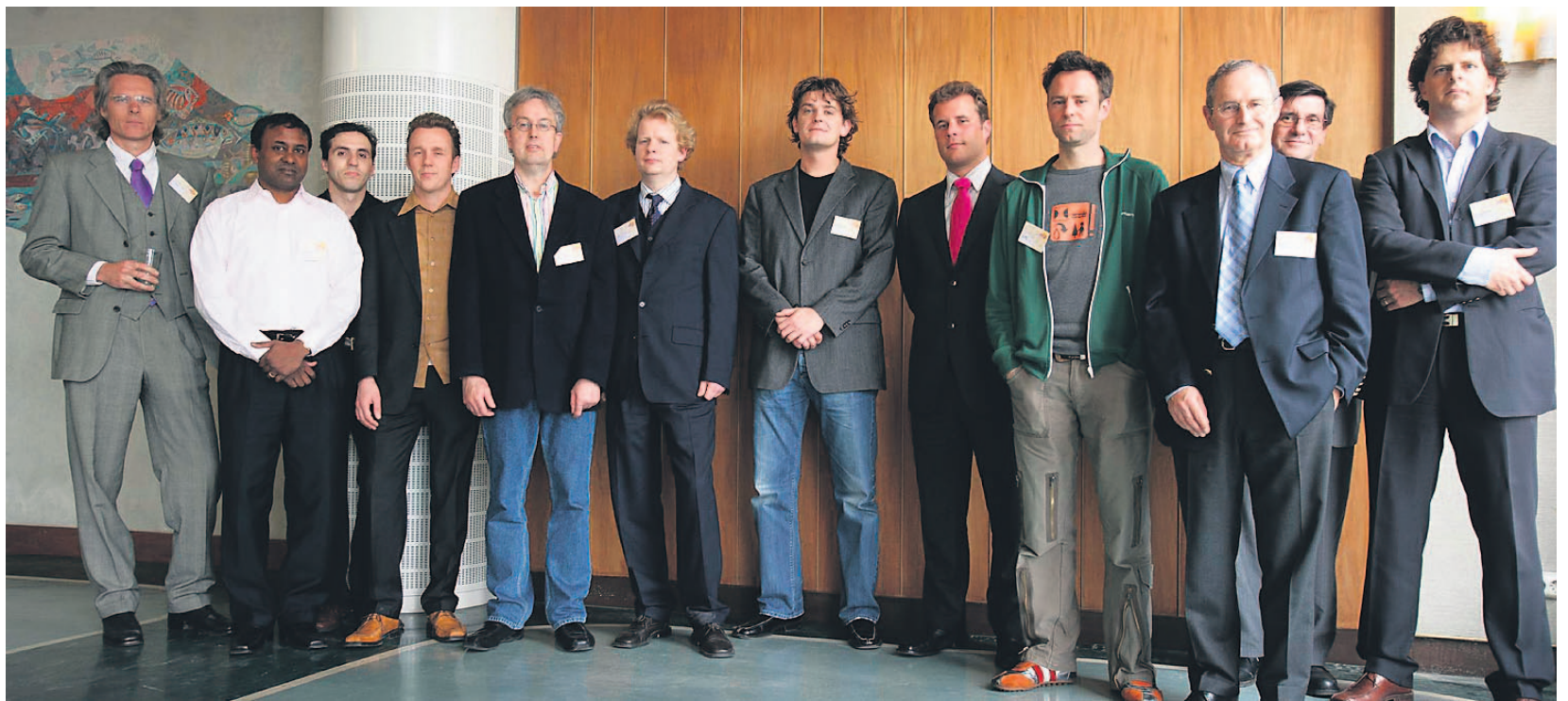
Daar staan ze dan, keurig op een rijtje, de mannen van bijvoorbeeld de plastic badmintonshuttle die vliegt als een van veren.